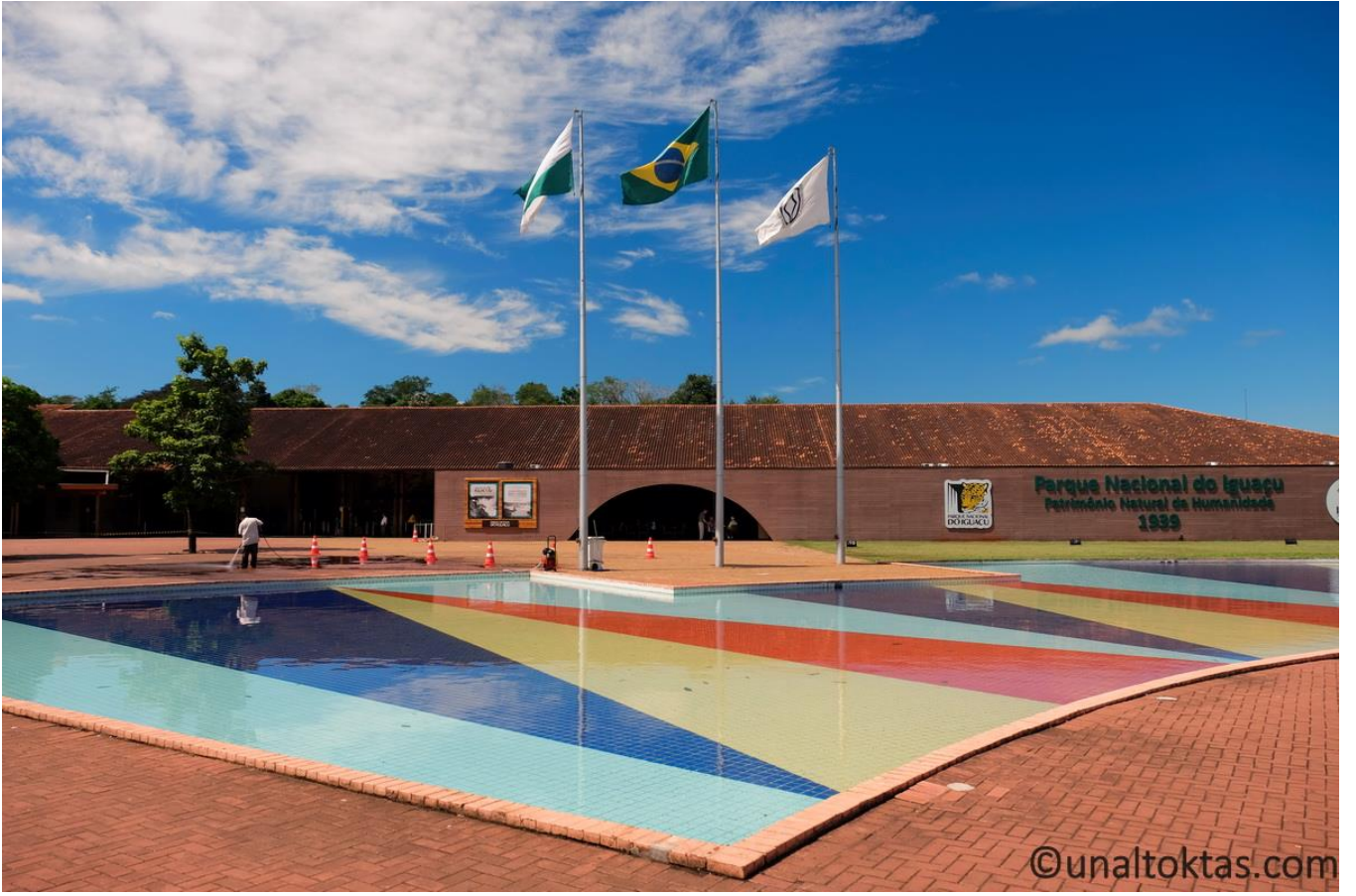
Şelalelerin Brezilya tarafında kalan kısımlarının fotoları